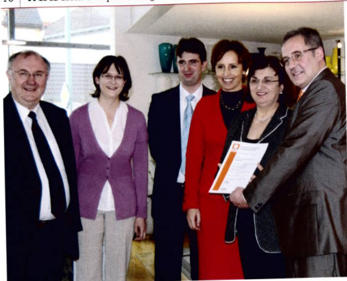
Mit Freude nimmt Familie Brandl die Auszeichnung entgegen.